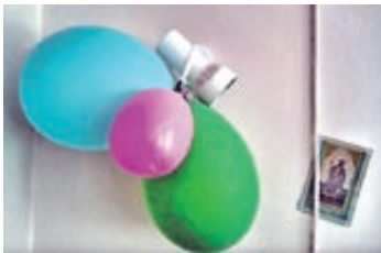
Szpital na peryferiach Katarzyna Łoza s. 16