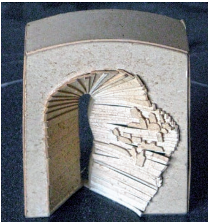
Makieta projektu z 1987 r.

Postępu w sprawie godnego upamiętnienia na Wzgórzach Wuleckich nie przyniosły kolejne rozmowy polsko-ukraińskie prowadzone na różnych szczeblach w początkach lat dziewięćdziesiątych, już w nowej