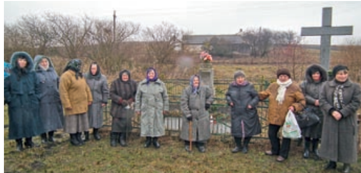
Uczestnicy uroczystości żałobnej na cmentarzu w Palikrowach

- Jest to dla nas szok – powiedzieli Polacy i Ukraińcy z pobliskich Palikrów, którzy po południu, 12 marca przy skromnym krzyżu na błoniach wspólnie obchodzili 73. rocznicę zagłady polskiej ludności tej wsi.