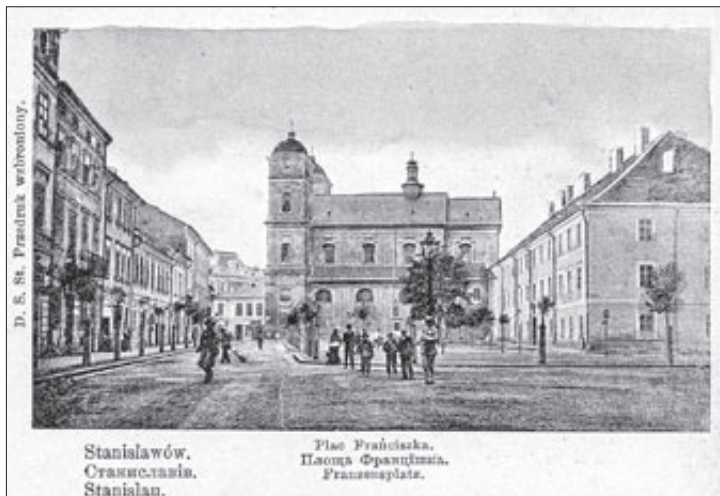
Plac Franciszka w Stanisławowie. Po prawej stronie budynek gimnazjum