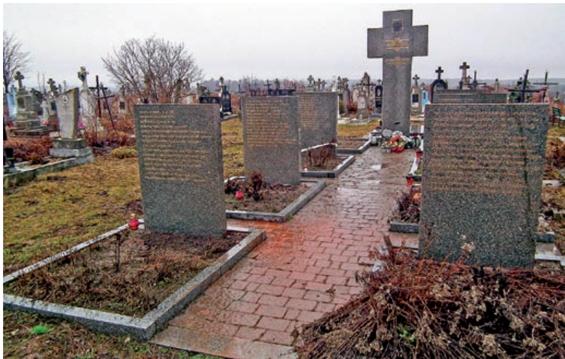
Cmentarz w Podkamieniu