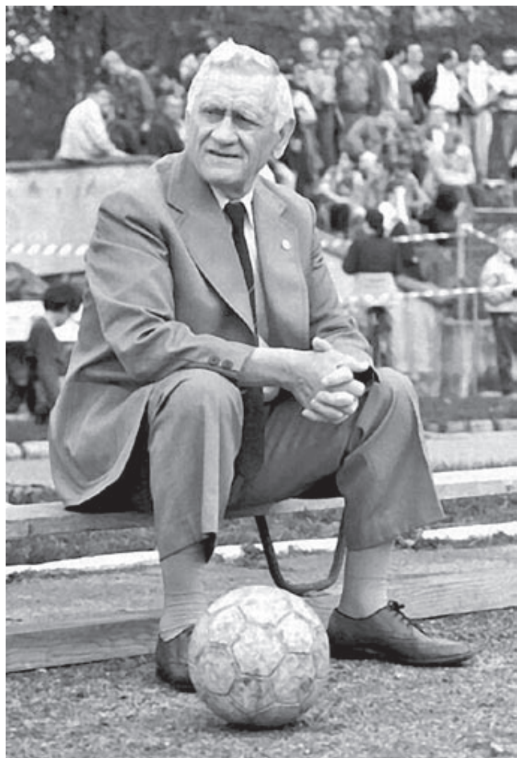
Słynne jest powiedzenie Górskiego: „Piłka jest okrągła, a bramki są dwie...”