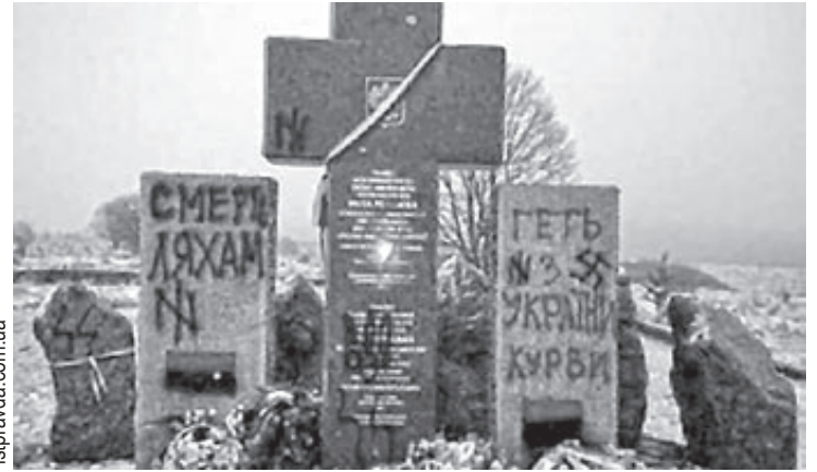
Po raz drugi sprofanowany pomnik w Hucie Pieniackiej

Przecież nie trzeba być szczególnie inteligentnym, by zrozumieć, iż podobne rzeczy niczemu prócz rozpalania nienawiści i chęci odwetu nie służą. To elementarne – żadnego pozytywnego efektu podobny wandalizm nie wywoła. Niczemu nie służy – również „polskim nacionalistom” (przepraszam, ale takie właśnie pojęcie na Ukrainie jest w tym przypadku używane). Nie słyszałem jeszcze by zdewastowanie jakiegoś pomnika OUN czy grobu UPA zmieniło kontrowersyjne dla Polaków poglądy któregoś z ukraińskich historyków, czy stało się dowodem polskiej racji