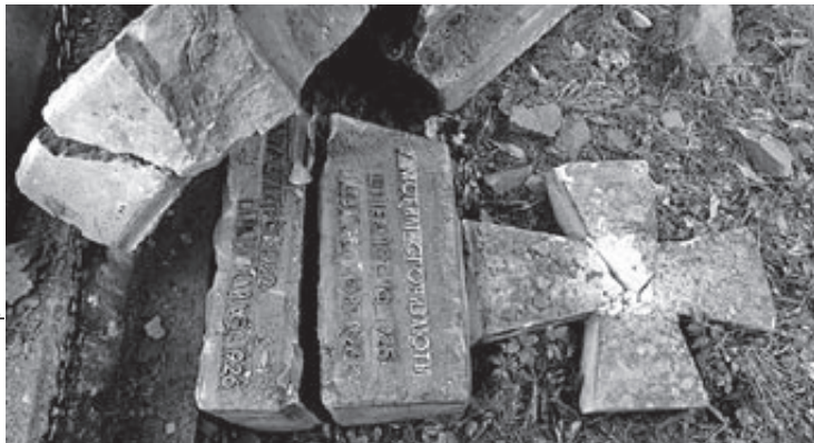
Zniszczony ukraiński pomnik w Werchracie na Podkarpaciu

Tym razem zwrócę uwagę na szczegóły. Właśnie swastyki na pol-skich pomnikach – to ma być niby symbol ukraińskich nacjonalistów? Ciekawe... Tryzub – tak, czarno-czer-wona flaga – tak, wiele innych sym-boli – tak, są powszechne i używane, ale swastyka? Prawda, są niewielkie grupki Ukraińców zachwycające się symboliką III Rzeszy, ale stanowczo jest to margines! Tak, to jest margines nawet wśród ukraińskich nacjonalis-tów! Absolutnie nie większy niż po-dobny margines w Polsce! Słowem