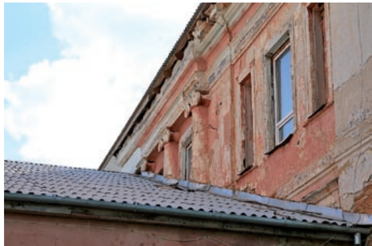
Zewnętrzne oryginalne zdobnictwo pałacu Jaroszyńskich w Tyrowie