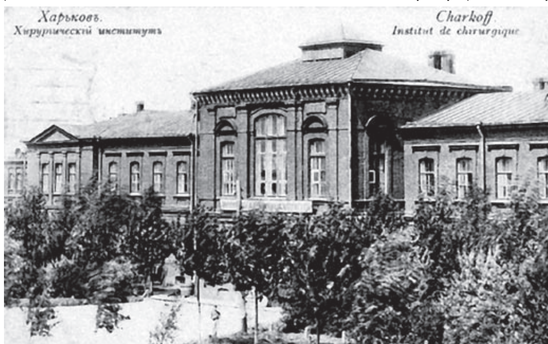
Instytut Chirurgii w Charkowie

kliniki terapeutycznej i akuszerskiej. Po obronie pracy doktorskiej przez kilka lat pogłębiał wiedzę we Francji i Austrii. Po powrocie wiele publikował. Miał propozycję na objęcie stanowiska wykładowcy w Petersburgu, jednak z powodu braku środków do życia, był zmuszony do powrotu do Charkowa. W 1868 roku otrzymał stanowisko wykładowcy toksykologii na wydziale medycyny sądowej. To za jego przyczyną w drugiej połowie XIX wieku w Charkowie toksykologia stała się bardzo „modnym” przedmiotem.