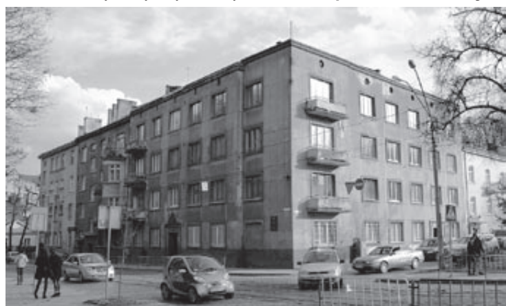
Kamienica przy ul. Pelczyńskiej 41 (obecna Witowskiego)

W Moskwie Tarnawiecka poznała Igora Belzę, znanego muzykologa i kompozytora, absolwenta Konserwatorium Kijowskiego w klasie kompozycji Borysa Latoszyńskiego. Oboje również mieli korzenie polskie. Obcowanie z tymi wybitnymi muzy-