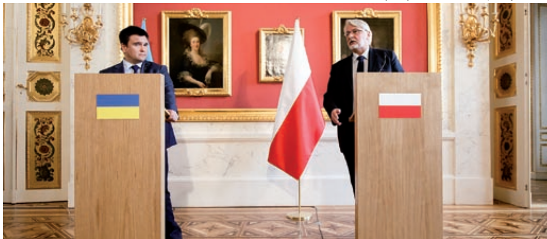
Szef MSZ Ukrainy Pawło Klimkin (od lewej) i szef MSZ RP Witold Waszczykowski

Minister Waszczykowski wyraził również nadzieję, że zainaugurowane Forum Polsko-Ukraińskie skupiające naukowców, przedstawicieli think tanków, ośrodków analitycznych, byłych dyplomatów, pozwoli rozszerzyć, wzbogacić relacje „poprzez wykreowanie nowych inicjatyw, nowych możliwości współpracy polsko-ukraińskiej”. Wymienił w tym kontekście m.in. debatę nad kwestiami historycznymi, a także nad podręcznikami