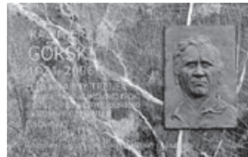
Pamiętkowa tablica na budynku przy ulicy Madalińskiego 49/51 w Warszawie, w którym mieszkał Kazimierz Górski

Wiosną 1990 roku Kazimierz Górski po wielu latach odwiedza swoje rodzinne miasto, spaceruje jego ulicami, sprawdza murawę stadionu z lat dzieciństwa i spotyka się z