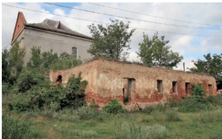
Kościół pokapucyński i pozostałości klasztoru w Kunie

Byłem tu po raz pierwszy w 2009 roku, gdy przygotowywałem przewodnik po Ziemi Winnickiej. Klasztor