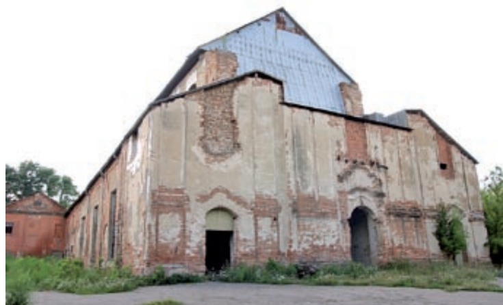
Poddominikański klasztor w Tyrowie przed odnowieniem