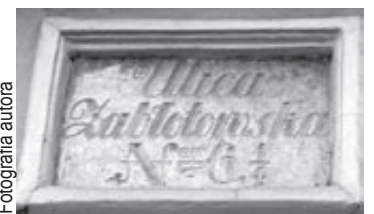
Zachowana nazwa ulicy Zablótowskiej