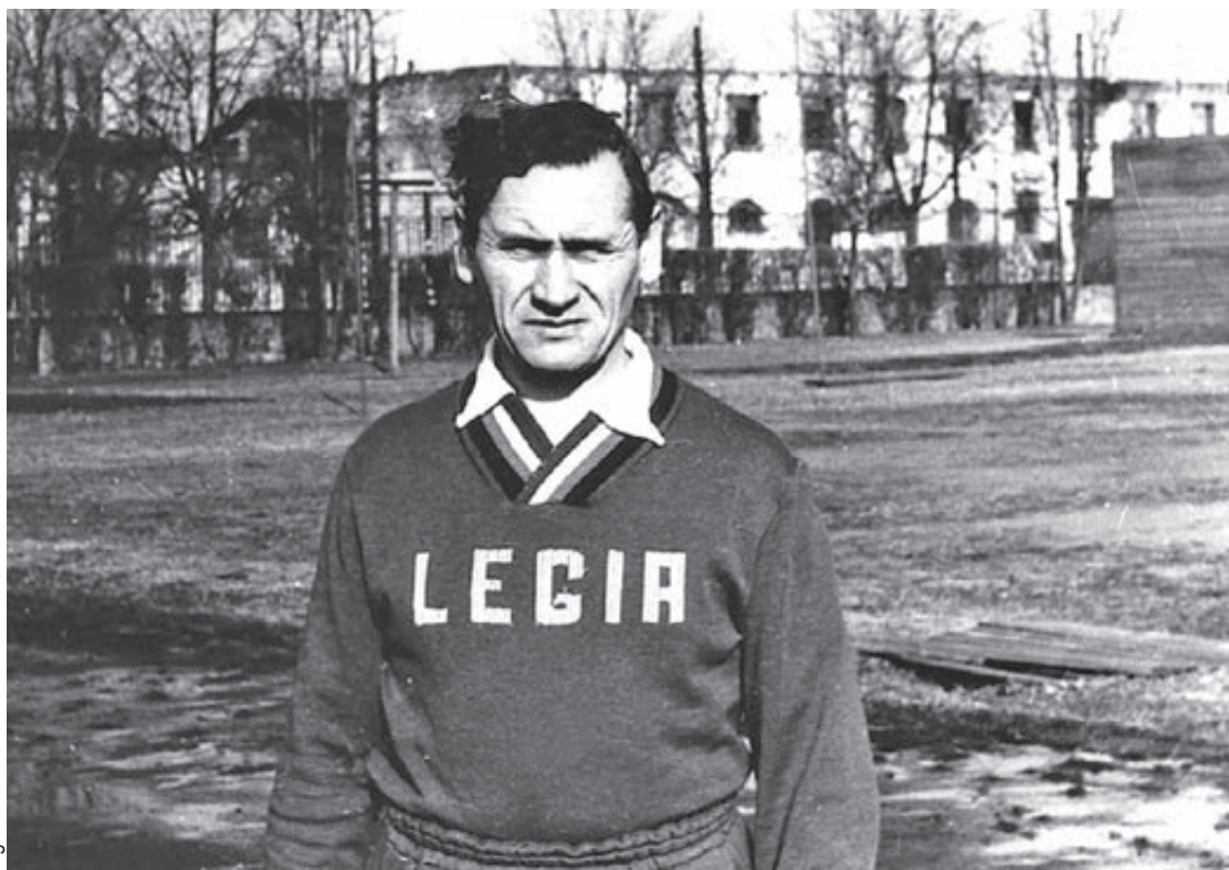
Kazimierz Górski zanotował z drużyną Legia Warszawa 60 zwycięstw, 42 remisy i 34 porażki

O swoim dzieciństwie i pierwszych krokach w piłce nożnej we Lwowie Kazimierz Górski interesująco pisze w swoich wspomnieniach „Pół wieku z piłką”. Po wyzwoleniu Lwowa spod okupacji niemieckiej wstąpił na ochotnika do Wojska Polskiego i z czasem znalazł się w woj-