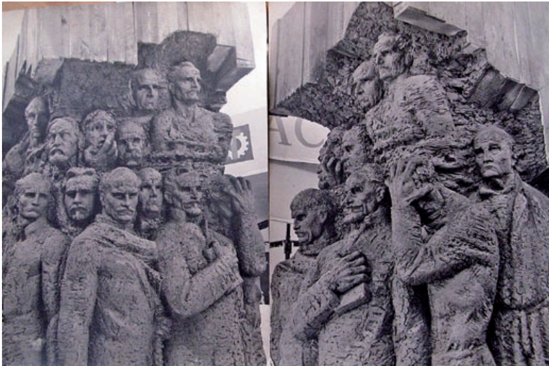
Modele z gliny pomnika z 1980 r.

Prace jednak szybko przerwano. Jeden z elementów w drewnianych rusztowaniach stał przez pewien czas na wzgórzu (kilka miesięcy?),