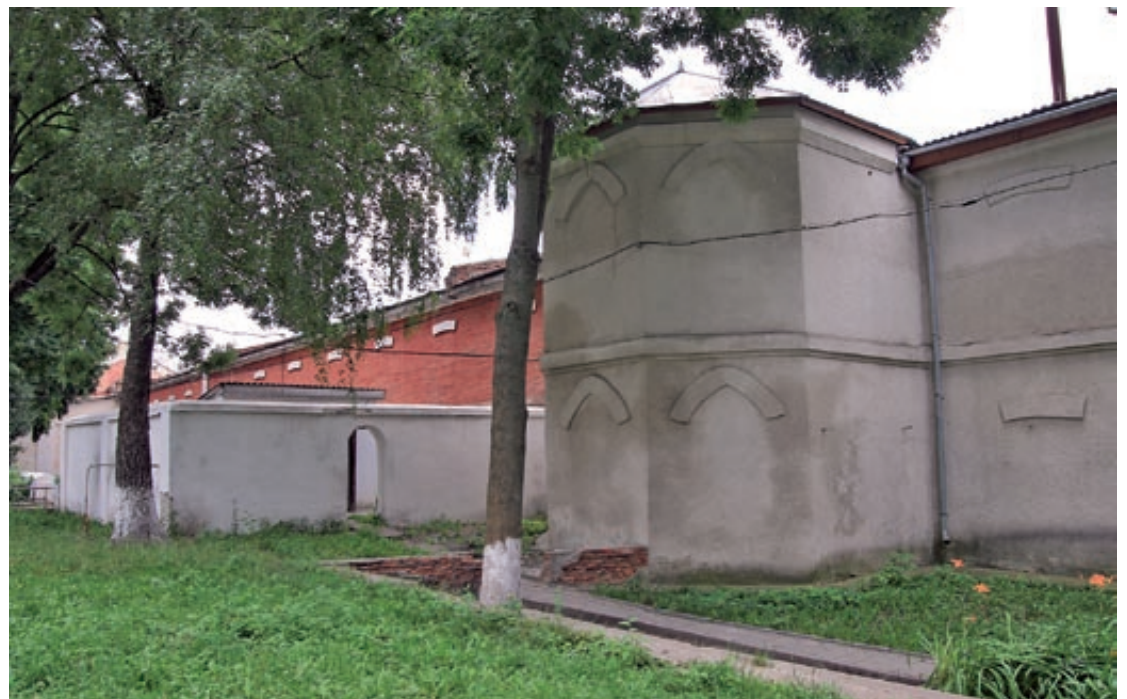
Mury i wieża cukrowni Jaroszyńskich w Babinie