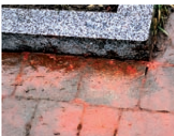
Kolejne profanacje polskich pomników Konstanty Czawaga s. 4