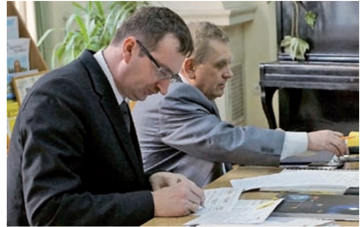
Podpisanie umowy o współpracy