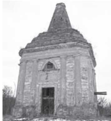
Kościół-zikkurat w Antoniówie